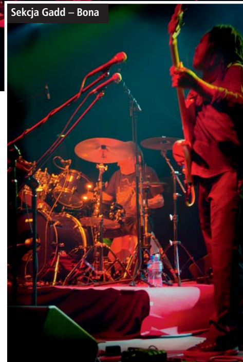
Sekcja Gadd – Bona

Ale to nie koniec przeżyć związanych z tym koncertem. Godzina 22:30. Oczekujemy w kularach