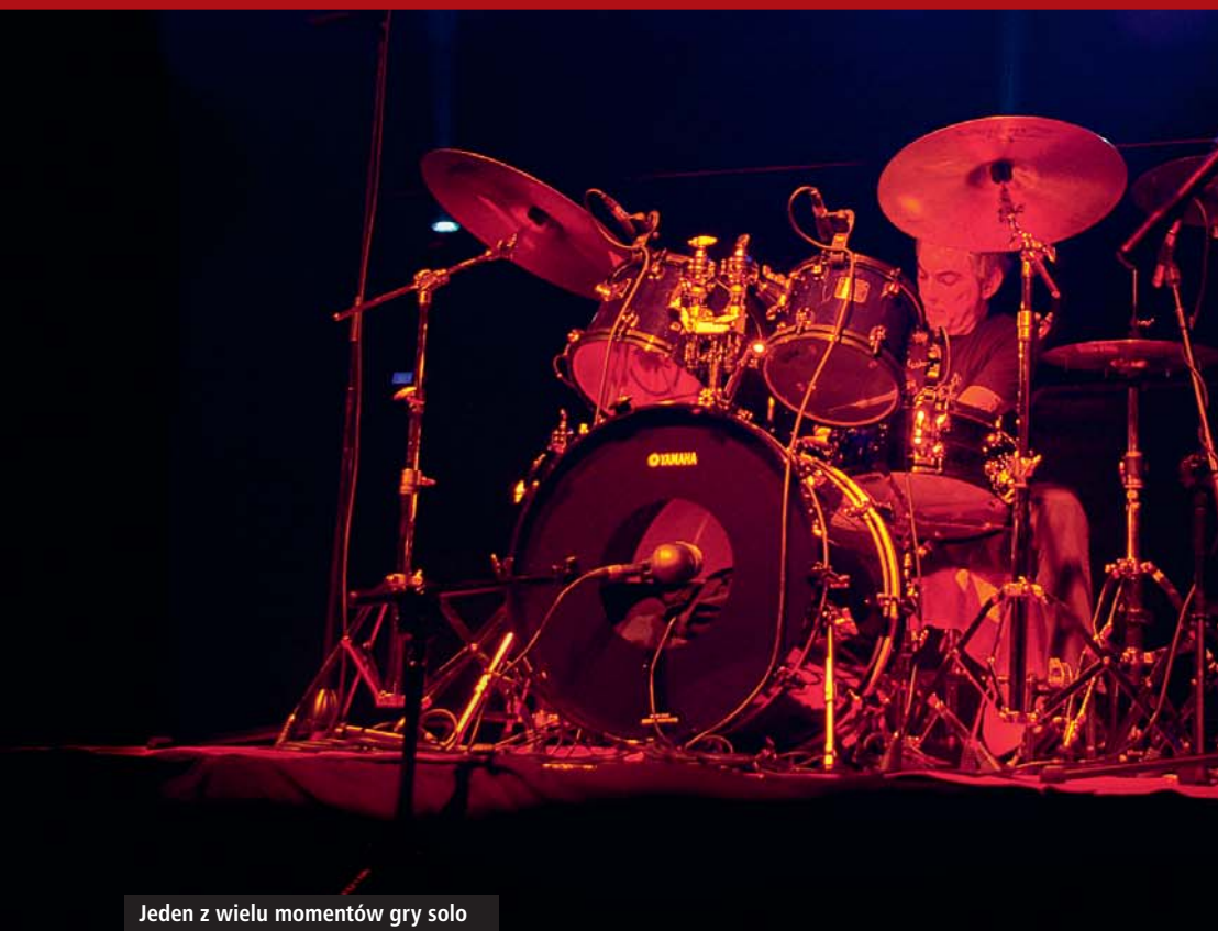
Jeden z wielu momentów gry solo

Mijają kolejne minuty i otrzymuję informację, że możemy przejść pod samą scenę, a w zasadzie na backstage. Dostają lekkich palpacji i biegiem udają się tam, by podziwiać mistrza z dystansu około 2 metrów. Wydawać by się mogło, że gra Steve'a Gadd'a jest ogólnie rozpoznawana i wszystko na ten temat wiadomo. Jednak z niewielkiej odległości można dostrzec szczegóły, na których opiera się warsztat tego wspaniałego perkusisty. Sposób artykułowania dźwięków, dynamika oraz łączenie różnych instrumentów (na przykład ride, werbel, hi-hat) poprzez znalezienie ich odpowiednich barw sprawia, że jego gra staje się wirtuozerska, nie tylko na poziomie technicznym, ale również mentalnym i poetyckim, a także nabiera niezwyklej przestrzeni i przejrzystości. Towarzyszące jego grze emocje sprawiają, że słuchacz przenosi się do innego świata, gdzie wyobraźnia nie zna granic, a doznania muzyczne nie są niczym skrepowane