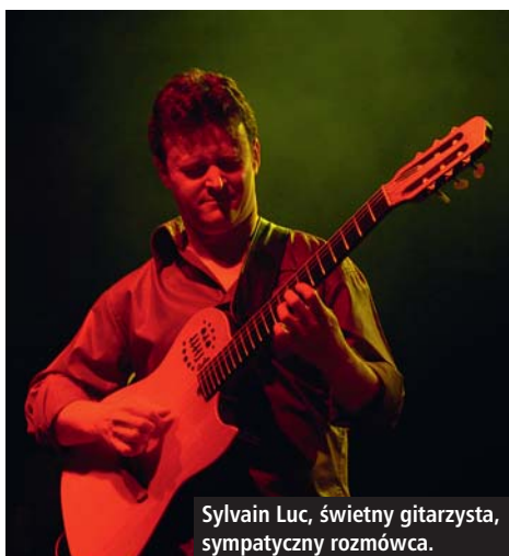
Sylvain Luc, świetny gitarzysta, sympatyczny rozmówca.