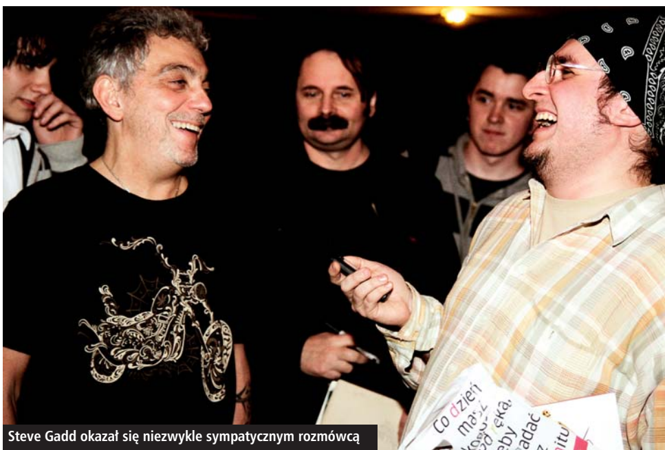
Steve Gadd okazał się niezwykle sympatycznym rozmówcą