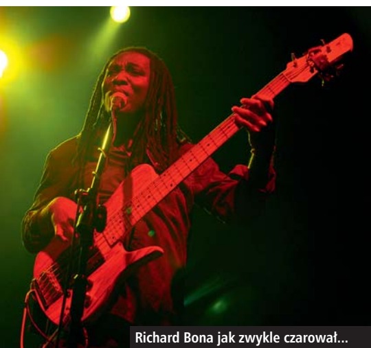
Richard Bona jak zwykle czarował...

Cały czas. Kogokolwiek usłyszę, staram się wynosić z jego gry, sposobu bycia za bębnami jak najwięcej pozytywnych rzeczy. Tak, żeby stało się to częścią mojej gry. Próbować wcielać to w siebie. Zresztą na tym polega to wszystko. Uczymy się wzajemnie od siebie. Od moich największych mentorów Gene'a Krupa i Buddy'ego Richa po współczesnych młodych perkusistów.