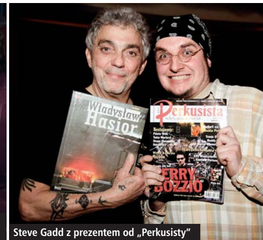
Steve Gadd z prezentem od „Perkusisty”